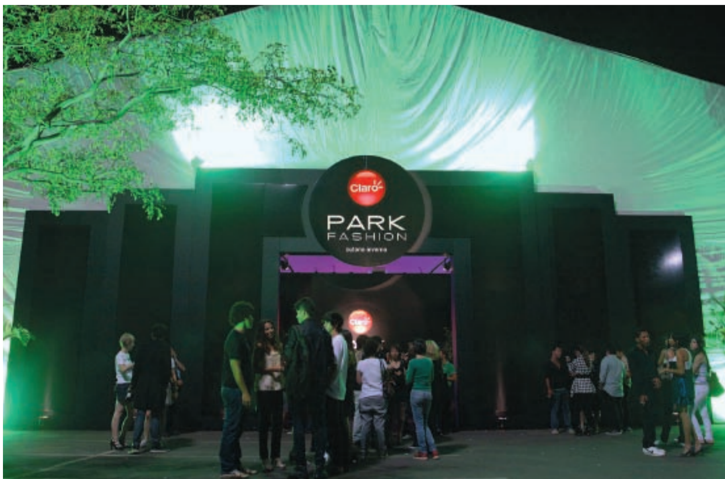
No line-up desfiles exclusivos e coletivos, que acontecem nas duas salas do ParkFashion. A sexta edição promete conceitos novos, além de um ar invernal e misterioso

O concurso fotográfico deste ano desafiará os participantes a realizarem um editorial de moda. O tema foi o mesmo do evento, A Fantasia da Moda: Mistérios de Inverno . "Privilegiamos mais a criatividade dos participantes do que a técnica", afirma Jackson Araujo, curador do evento. Participaram do concurso fotógrafos não-profissionais e amantes da moda em geral. Os prêmios são um vale-compras de R$ 5 mil em lojas do shopping e um pacote de viagem com direito a acompanhante.